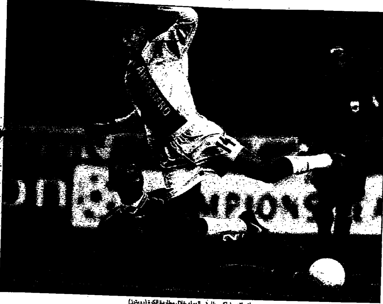
داني لاس بيكس يلعب في الهواء خلال مطرمة الكرة (روبيتر)